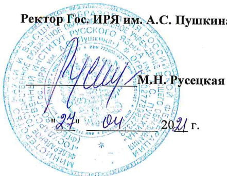
График учебного процесса